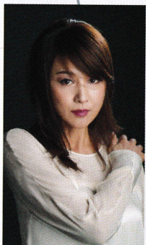
藤原紀香 エリザベート