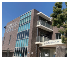
多肥メディカル ビル 徒歩12分(約900m)