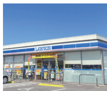
ローソン高松 多肥上町平塚店 徒歩9分(約700m)