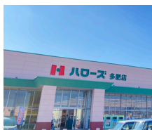
ハローズ 多肥店 徒歩9分(約650m)