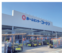
コーナン 多肥店 徒歩9分(約650m)

■物件概要●所在地/香川県高松市多肥上町 133-1●交通/高松琴平電鉄琴平線 太田 徒歩8分(約600m)●土地面積/A区画:127.57㎡●用途地域/第一種住居地域●地目/田●建ぺい率/60%●容積率/200%●総区画数/2区画●販売区画数/1区画●販売価格/1,180万円●接道状況/南側約5.00m 公道、北側約4.00m 公道●物件設備/都市ガス、上水道、下水道、側溝、電気●取引態様/売主 四国ホーム株式会社●広告有効期限2026年1月31日