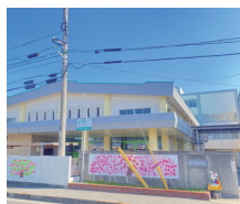
高松市立 多肥小学校 徒歩11分(約850m)