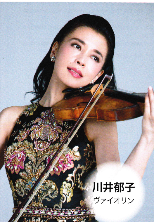
川井郁子 ヴァイオリン