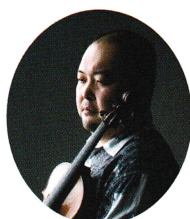
降旗貴雄 (ヴァイオリン)