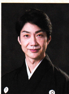
野村 萬斎 MANSAI NOMURA