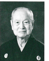
野村 万作 のむら まんざく

題名の千切木は、時機に遅れて役に立たな いという意味の「諍い果てての千切木」という 諺からとられた言葉です。弱虫の割には強が る夫と、気は強いが夫思いの妻のやりとりの妙 をお楽しみ下さい。