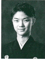
野村 裕基 のむら ゆうき

1966年生。祖父・故六世野村万蔵及び父・野村万作に師事。重要 無形文化財総合指定者。三歳で初舞台。東京芸術大学音楽学部卒業。 『狂言ござる乃座』主宰。国内外で多数の狂言・能公演に出演する一 方、現代劇や映画・テレビドラマの主演、敦・山月記・名人伝―「マク ベス」「子午線の祀り」「能 狂言」「鬼滅の刃」「ハムレット」「能 狂言― 日出处の天子―」はじめ古典の技法を駆使した作品の演出など、現 在の日本の文化芸術を牽引するトランジションのひとりとして幅広く 活躍。94年に文化庁芸術家在外研修制度により渡英。芸術祭新人賞・ 優秀賞、芸術選奨文部科学大臣新人賞、朝日舞台芸術賞、紀伊國屋演 劇賞、毎日芸術賞千田是也賞、観世寿夫記念法政大学能楽賞、松尾芸 能大賞等受賞多数。24年度坪内逍遙大賞を受賞。石川県立音楽堂 アーティスト・クリエティブ・ディレクター、東京芸術大学・日本大 学芸術学部客員教授。(公社)全国公立文化施設協会会長。