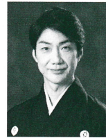
野村 萬斎 のむら まんざく

1931年生。重要無形文化財各個指定保持者(人間国宝)、文化 功労者。日本芸術院会員。23年文化勲章を受章。祖父・故初世野村萬 斎及び父・故六世野村万蔵に師事。三歳で初舞台。早稲田大学文学部 卒業。「万作の会」主宰。軽妙洒脱かつ品格ある芸で国内外で狂言普 及に貢献。ハワイ・大・ワシントン大では客員教授を務める。芸術祭大 賞、紀伊國屋演劇賞、日本芸術院賞、紫綬褒章、坪内逍遙大賞、朝日 賞、中日文化賞、ニューヨーク・ジャズ・パノソニエ賞等受賞多数。24年度 NHK放送文化賞受賞。早稲田大学芸術功労者、練馬区名誉区民。 『月に憑かれたビエロ』『子午線の祀り』『法螺待』『敦』『山月記』名人 伝―等、狂言師として新たな試みにもしばしば取り組む。現在に至 る狂言隆盛の礎を築く。後進の指導にも尽力。著書に『太郎冠者を生 きる』(白水社・アップクス)、『狂言を生きる』(朝日出版社)等。練馬文 化センター名誉館長。2025年、九十年を超える芸境を記録した映 画『六つの顔』公開。