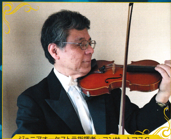
ジュニアオーケストラ指揮者・コンサートマスター