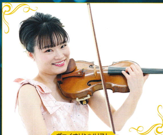
ヴァイオリンソリスト