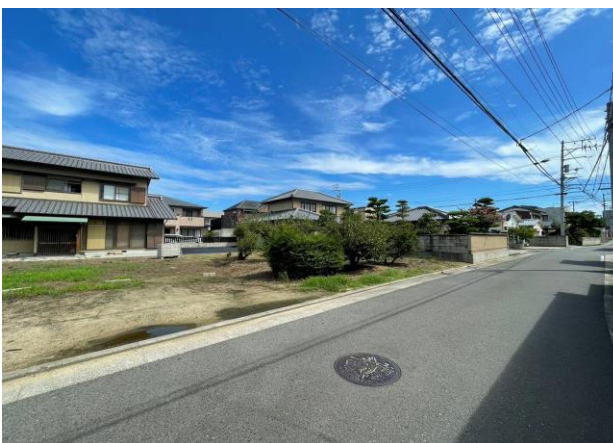
<ライフインフォメーション>