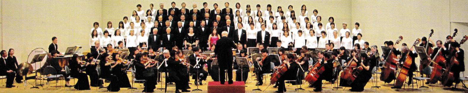
2019まるがめ第九演奏会(会場:アイレックス)