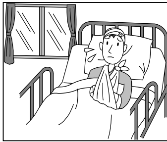
ゴルフプレー中のケガ