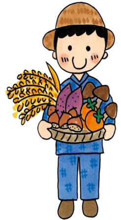
和栗とサツマイモのタルト