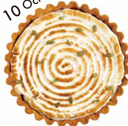
かぼちゃのタルト Pumpkin