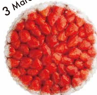
女峰とクリームチーズのタルト Strawberry Cream cheese