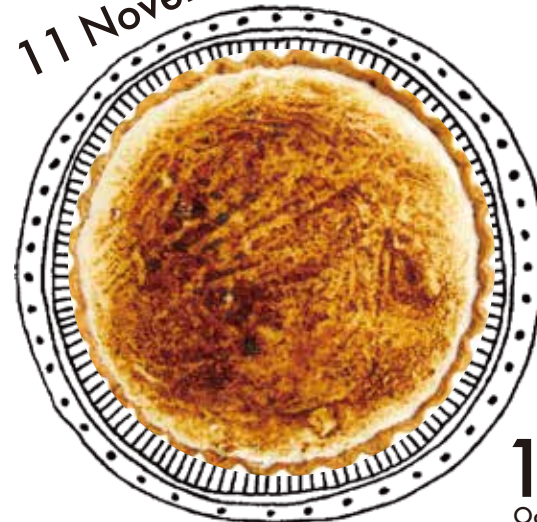
紅玉のシブーストタルト Kogyoku Shibusuto