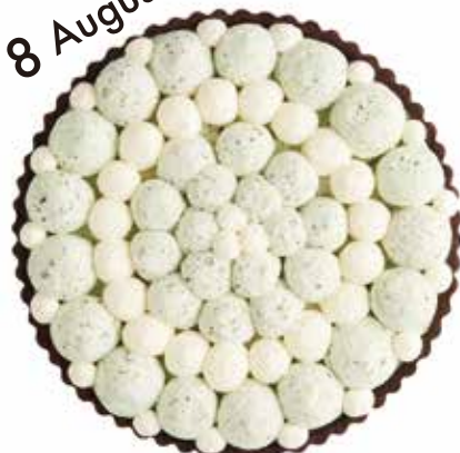
チョコミントのタルト Chocolate Mint