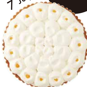
ばななとヨーグルトのタルト Banana Yogurt