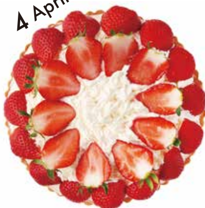
苺ティラミスのタルト Strawberry Tiramisu