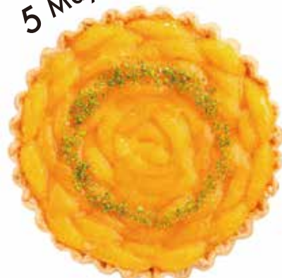
オレンジチョコタルト Orange Chocolate