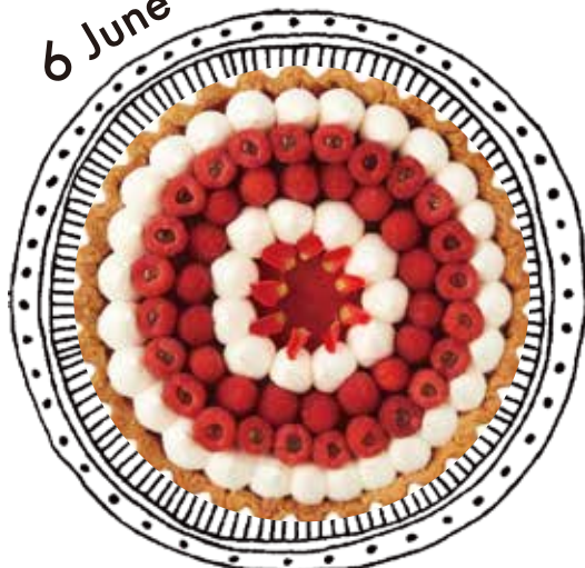
赤いフランボワーズのタルト Red Framboise