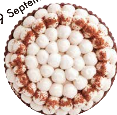
チョコバナナのタルト Chocolate Banana