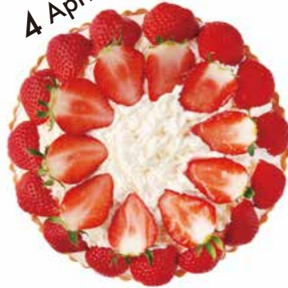
苺ティラミスのタルト Strawberry Tiramisu