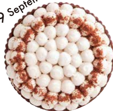
チョコバナナのタルト Chocolate Banana