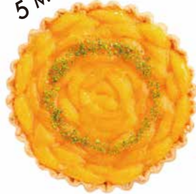
オレンジチョコタルト Orange Chocolate