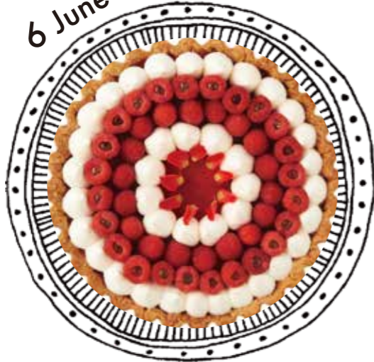
赤いフランボワーズのタルト Red Framboise