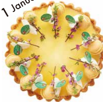
柚子とお豆腐のタルト Yuzu tofu