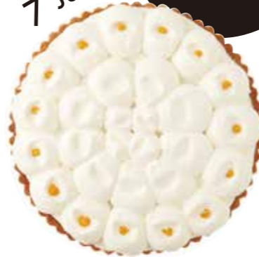
バナナとヨーグルトのタルト Banana Yogurt