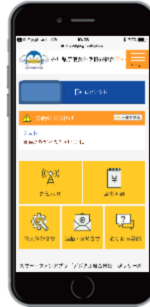
マイページメニュー画面