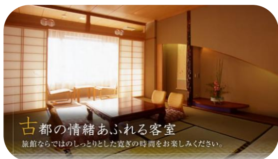
古都の情緒あふれる客室 旅館ならではのしっとりとした寛ぎの時間をお楽しみください。

大浴場には宇治から取り寄せた お茶を贅沢に入れてあります。 カテキンの作用で美肌にも 効果的♪