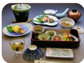
朝食イメージです