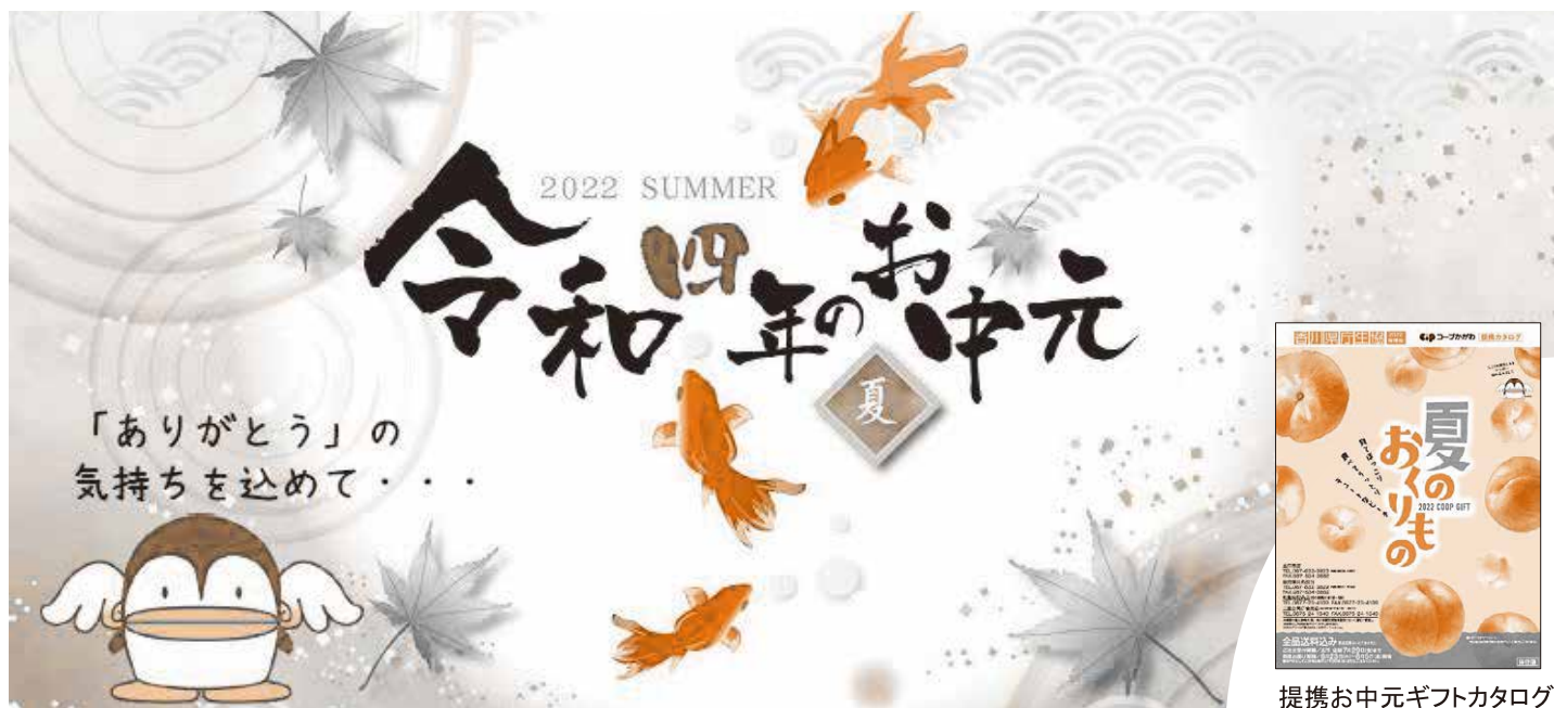
提携お中元ギフトカタログ