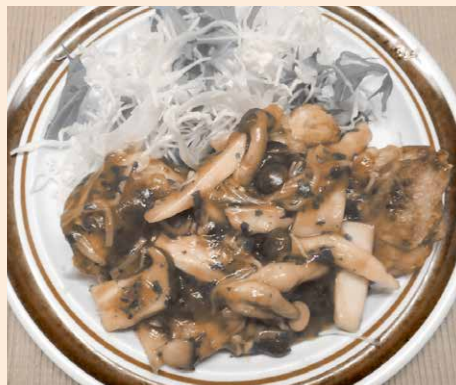
●本庁食堂/福崎 一人分 460キロカロリー