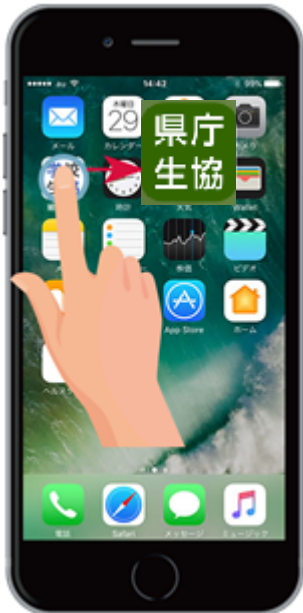
アプリのアイコンをタップ