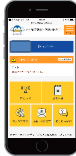
マイページメニュー画面