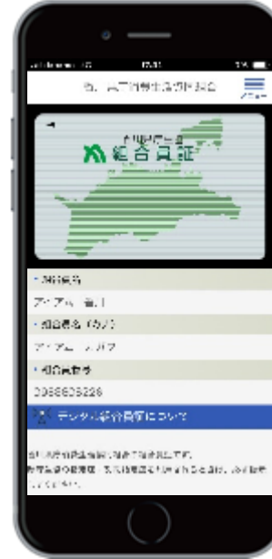
デジタル組合員証画面