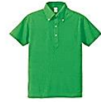
025 ブライトグリーン