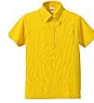
190 カナリアイエロー