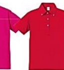
511 トロピカル ピンク