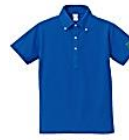
085 ロイヤル ブルー