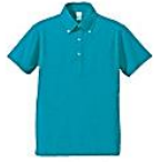
538 ターコイズブルー