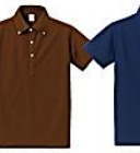
052 ダーク ブラウン